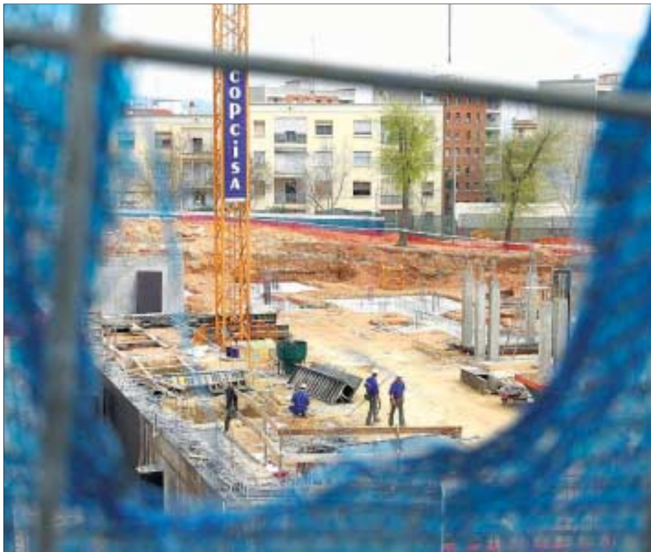
Los operarios trabajaban ayer en la construcción de los últimos pisos para los desalojados.