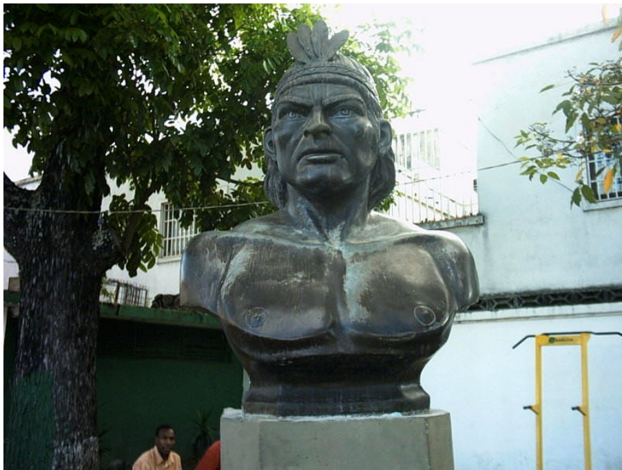
Bust de l'indi Baruta en el municipi de Baruta, Veneçuela.

Josep Barba Raventós Recerca de moliners.com