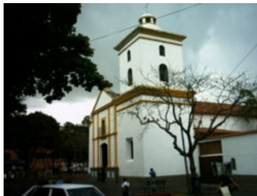
Iglesia Nuestra Señora del Rosario de Baruta