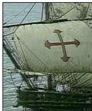
Los restos de Colón viajaron de un lugar a otro.

En 1877, un equipo de trabajadores que hacía excavaciones dentro de la catedral de Santo Domingo, desenterró una caja que contenía 13 fragmentos largos de hueso y 28 más pequeños. En ella estaba inscrito el nombre de Cristóbal Colón.