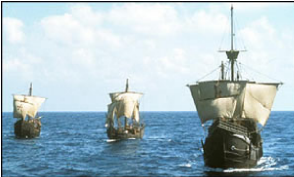
Réplicas de las carabelas de Colón, la Niña, la Pinta y la Santa María.

Científicos españoles anunciaron la exhumación de los presuntos restos de Cristóbal Colón en Sevilla para efectuarle pruebas de ADN y compararlas con los de su hermano Diego y su hijo Hernando.