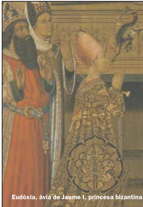
Eudòxia, àvia de Jaume I, princesa bizantina.

Com que, segons ell, "el copista era ignorant de la llengua francesa i, sens dubte, poc curós, i les faltes comeses no només revelen greus modificacions de contingut sinó que indiquen, sobretot, que