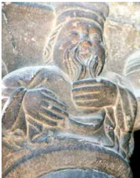
Dos mongols esculpits al monestir de Ripoll.