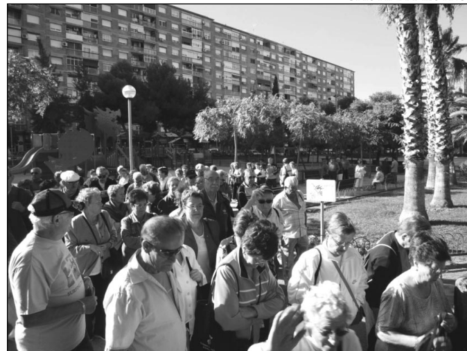
1-Original concentración en la B-23. 2- Personajes de 'La catedral del mar' donan guías de transporte público en Sant Joan Despí. 3- Passeja de Gent Gran, ayer en Cornellà

versión resolvería los problemas de saturación que tiene esta vía de entrada y salida a la Diagonal por el Baix Llobregat.