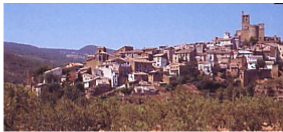
Panoràmica d'Àger (Pirineu de Lleida)