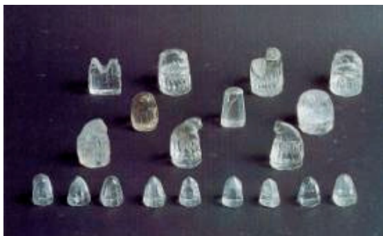
Escacs d'Àger. Actualment en el Museu Diocesà de Lleida

Aquest municipi d'Àger també està relacionat amb un enigmàtic jocs d'escacs que faria pensar a molts del qui han llegit la novel·la "El 8" de la Katherine Neville. Aquesta novel·la té en la recerca d'un misteriós jocs d'escacs i la seva taula la seva trama argumental i es diu que van estar presents a una abadia dels Pirineus.