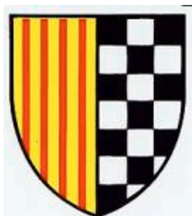
Escut d'Àger (Comarca del Pallars) amb els quatre pals catalans que poden simbolitzar el Tetragramma de la càbala que es relaciona amb els Cavallers de l'Orde del Temple del Rei Salomó i els escacs o escacats heràldics de la nissaga d'Urgell

Alguns estudiosos consideren que aquesta "taula d'escacs" era la famosa "Taula del Rei Salomó". Altres diuen que aquesta taula portava dibuixat en la part de sota un mapa amb la distribució de les nacions de la Terra en funció d'una distribució i configuració astrològica. També n'hi ha que la relacionen amb les "Taules de Moisès" i amb el culte a la imatge de "Nostra Dona de les Taules" de Montpeller, verge negra davant la qual va ser batejat el rei català Jaume I el Conqueridor, que era de la nissaga d'Urgell.