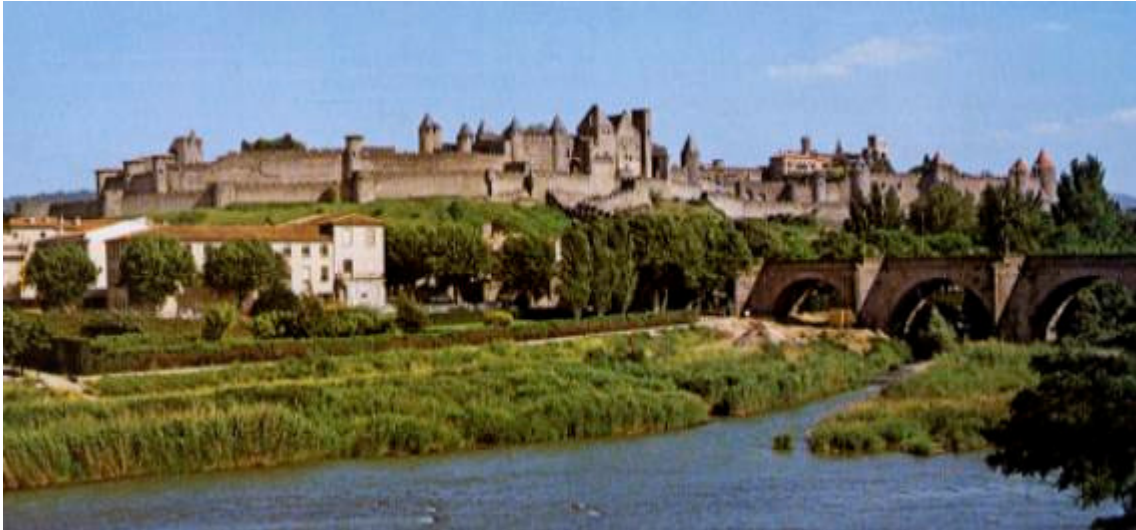
Panoràmica de Carcassona (Occitània)