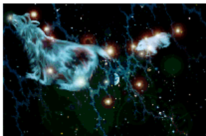
Constel·lació Carro Gros o Ossa Gran

Segons la tradició hermètica i astrològica, els cèrvols del Pare Noël, representen una constel·lació astral i el carro, on porta els regals, representa l'Ossa Grossa, coneguda també amb el nom de "carro". (El "carro" és també un concepte cabalístic i està relacionat amb el Tarot. Pot ser astrològic o potser referit al carro del quan parla el profeta Ezequiel. D'aquest carro d'Ezequiel també se n'han expressat opinions que el relacionen amb els fenòmens ovni. El carro esdevingut símbol té diverses interpretacions.