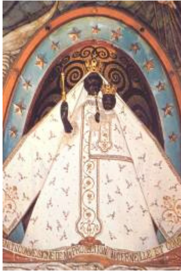
Nostra Dona la Daurada. Catedral Tolosa Llegua d'Occ (Occitània)

Recordem que els trobadors van constituir els Jocs Florals davant la imatge de Nostra Dama la Daurada verge negra de la catedral de Tolosa de Llengua d'Occ.