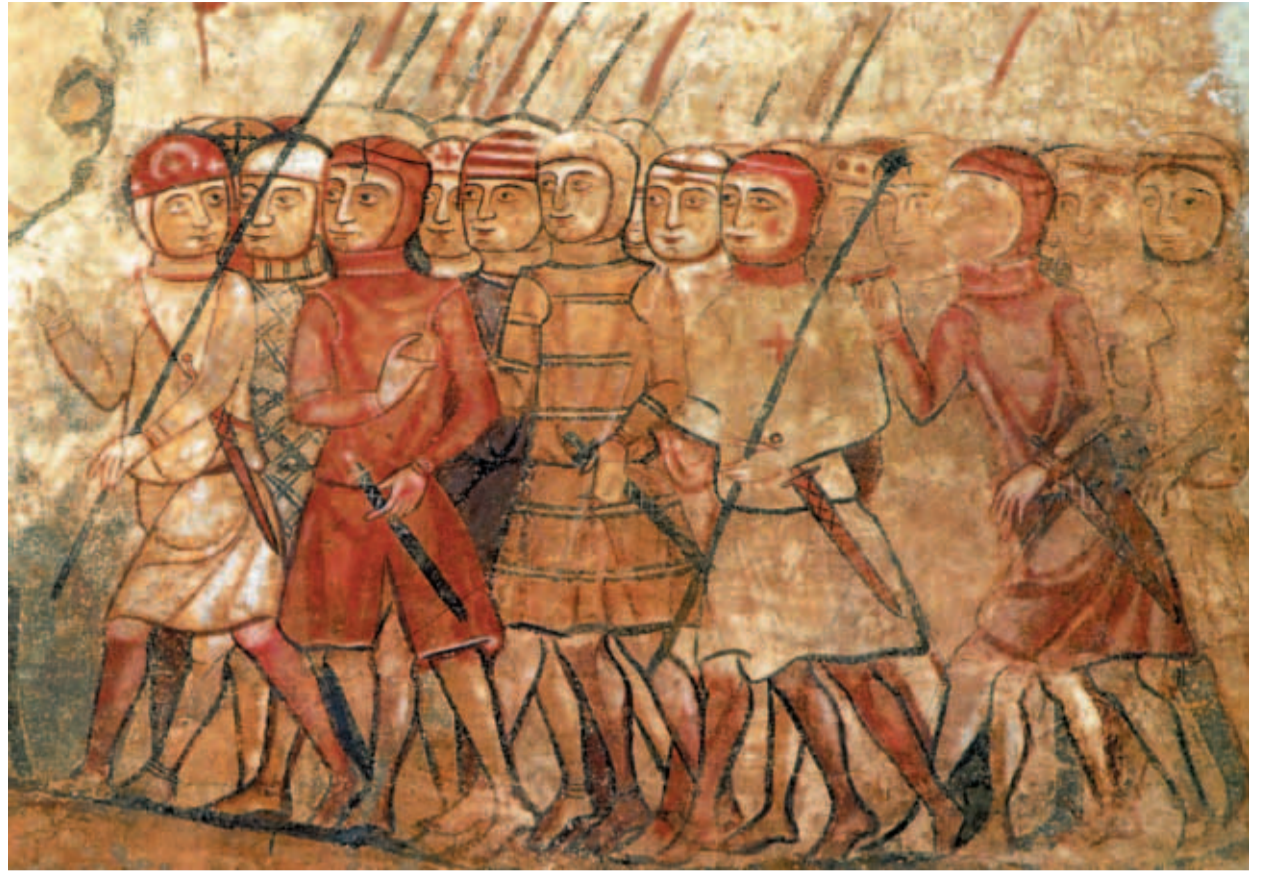
Tropes d'infanteria en un fragment de les pintures murals del Saló del Tinell de Barcelona (segle XIII)

La notícia de l'arribada dels enviats de l'il-khan Abaqa i dels seus aliats sorprengué el rei Jaume d'Aragó a l'estranger. El Conqueridor era en aquests darrers dies de 1268 a Toledo, a la cort del seu gendre Alfons X de Castella, on havia festejat el Nadal. El motiu principal del seu viatge havia estat d'assistir personalment a la consagració arquebisbal del seu fill menor, l'infant Sanç d'Aragó. La promoció de l'infant a la seu primada d'Hispania havia estat un afer accidentat, un negoci complicat en el qual s'havien implicat molt els reis d'Aragó i de Castella. No és pas, doncs, gens estrany que ambdós monarques volguessin ser testimonis directes de la victòria final del seu candidat. El rei cronista ens ha deixat en la seva obra un record plaent d'aquests dies d'hivern castellà, en la grata companyia de la seva filla Violant i també dels seus néts, els infants de Castella.