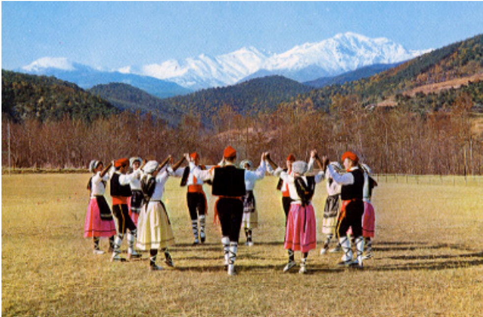
La sardana. Misteriosa dansa catalana .El Canigó al fons.

Jo crec en la confederació de nacionalitats naturals autòctones i la seva estructura econòmica com a base d'una societat més justa i més equilibrada sota criteri objectiu i vernaclista. Una mena d'Estats Units, però basat en l'ordre de les nacionalitats naturals més que no pas en l'ordre de els Estats no-vernacles, alguns es diuen ara "constitucionals". Això ho haurien de tenir present els que volen construir Europa. Creu en l'Europa de les nacions vernacles i no en l'Europa dels Estats no-vernacles. Aquesta mentalitat comporta una més justa distribució de la riquesa, un millor benestar social i una integració amb la naturalitat que ens fa participar en la Creació.