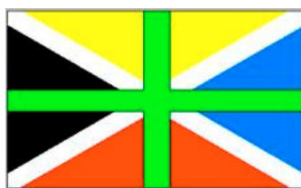
Bandera de Pirènia

Hèrcules, enamorat de Pirena, va deixar el seu cos a terra i va cobrir-lo amb gran pedres, tot formant les muntanyes del Pirineu. Aquestes muntanyes són el centre de gravetat d'unes valls i terres que tenen una ànima pròpia lligada a un esperit universal.