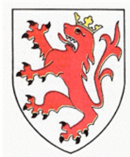
Escut heràldic dels Erill. Nissaga pirinenca de Ramon LLull

Així, doncs, parlar de Pirènia no es res de nou. Es parlar d'una de les primeres pedres que senten les bases d'una Europa construïda amb criteri vernaclista. Cal ficar, en algun lloc dels Pirineus, de forma simbòlica, la primera pedra de tot edifici de Pirènia perquè es pugui anar construint l'edifici d'Europa.