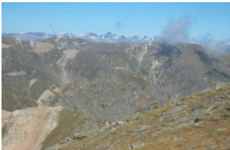
Panoràmica del Pirineu des de les Nou Creus amb el Carlit al fons

En el llibre inspirat en Ramon Llull abans esmentat i escrit per E.C. Agrippa, es diu com s'han de senyalitzar les fronteres nacionals sota aquest criteri.