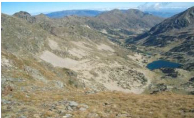
Panoràmica des del Puig de Nou Creus dalt de Núria al costat de la Fossa del Gegant Ferragut

Tot sovint he comprovat que quan es troben dos catalans que volen el mateix, enlloc de fer un equip es fan la competència. Hi ha un excés d'individualitat i una in-solidària desconfiança, que pot ser fruit d'una ètica egoista. Vagi jo calent - diu un vell refrany popular català - se me'n fot l'altra gent.