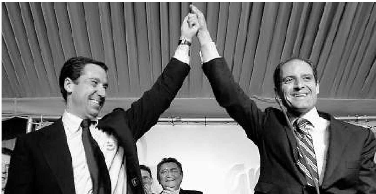
Dalt, caricatura de Joan Fuster, exhibida en l'última exposició del Muvim sobre l'assagista valencià. Baix, Zaplana i Camps celebren la victòria del PP en les eleccions autonòmiques del 2003.

me de Felip d'Anjou. La República, perquè va conèixer la maduració del valencianisme com a moviment polític, finalment frustrada per la Guerra Civil. I la Transició, perquè la forta càrrega nacional que va assumir l'oposició antifranquista, i de la qual es va contagiar la societat, va ser liquidada des d'uns quants despatxos per por que l'emergència d'un altre