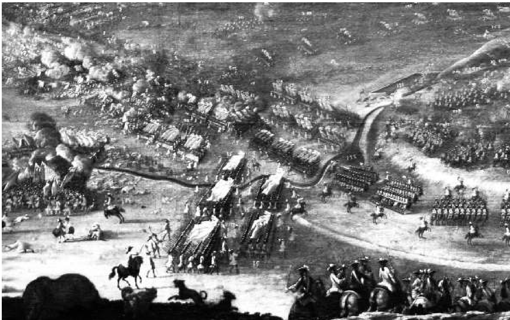
Escenes del quadre sobre la batalla d'Almansa de Buonaventura Ligli, pintat el 1709 i exposat a la mostra sobre la contesa inaugurada el 22 de març a València.