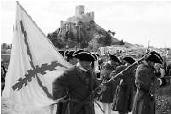
Assaig de la recreació de la batalla.

El dia 25 se celebrarà el «dia del centenari» amb desfilades d'unitats militars amb uniformes històrics, inauguració d'una exposició antològica, ofrenes florals, hissada de banderes dels països participants en el combat, dinar popular i un concert de música barroca.