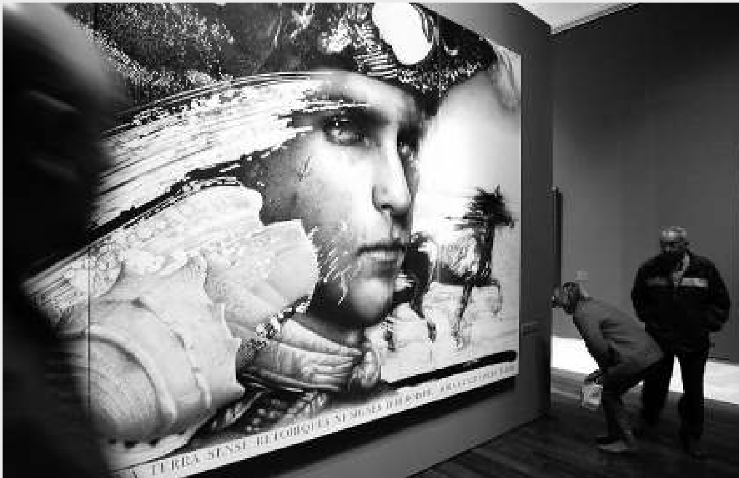
Còpia del retrat al·legòric de Basset que ha fet recentment Manuel Boix. / JOSÉ CUÉLLAR

Al seu país, Basset va ser aclamat pels camperols, que van veure en ell no només un excel·lent militar, sinó un abanderat de les reformes socials, atesa la se-