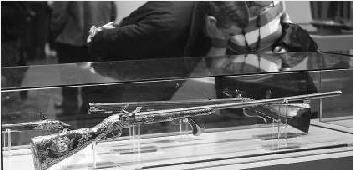
Dalt, quadre «La batalla de Almansa», de Ricardo Balaca i Orejas Canseco. Baix, fusells de l'època. / J. CUÉLLAR

L'èxit d'aquestes operacions va fer dels territoris de la Corona d'Aragó la millor plataforma per als plans de Carles en la guerra. Però el seu objectiu principal era la conquesta de Madrid, una plaça on mai no va trobar l'adhesió popular de què va gaudir a València i Catalunya.