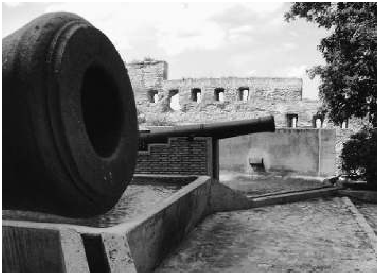
Canons al castell de Xàtiva, que va resistir tres setmanes el setge dels borbònics comandats pel cavaller d'Asfeld. / E.P.

D'altra banda, a desenes de localitats s'estan organitzant al llarg de tot el mes programes de conferències a càrrec d'historiadors i debats a propòsit de l'efemèride.