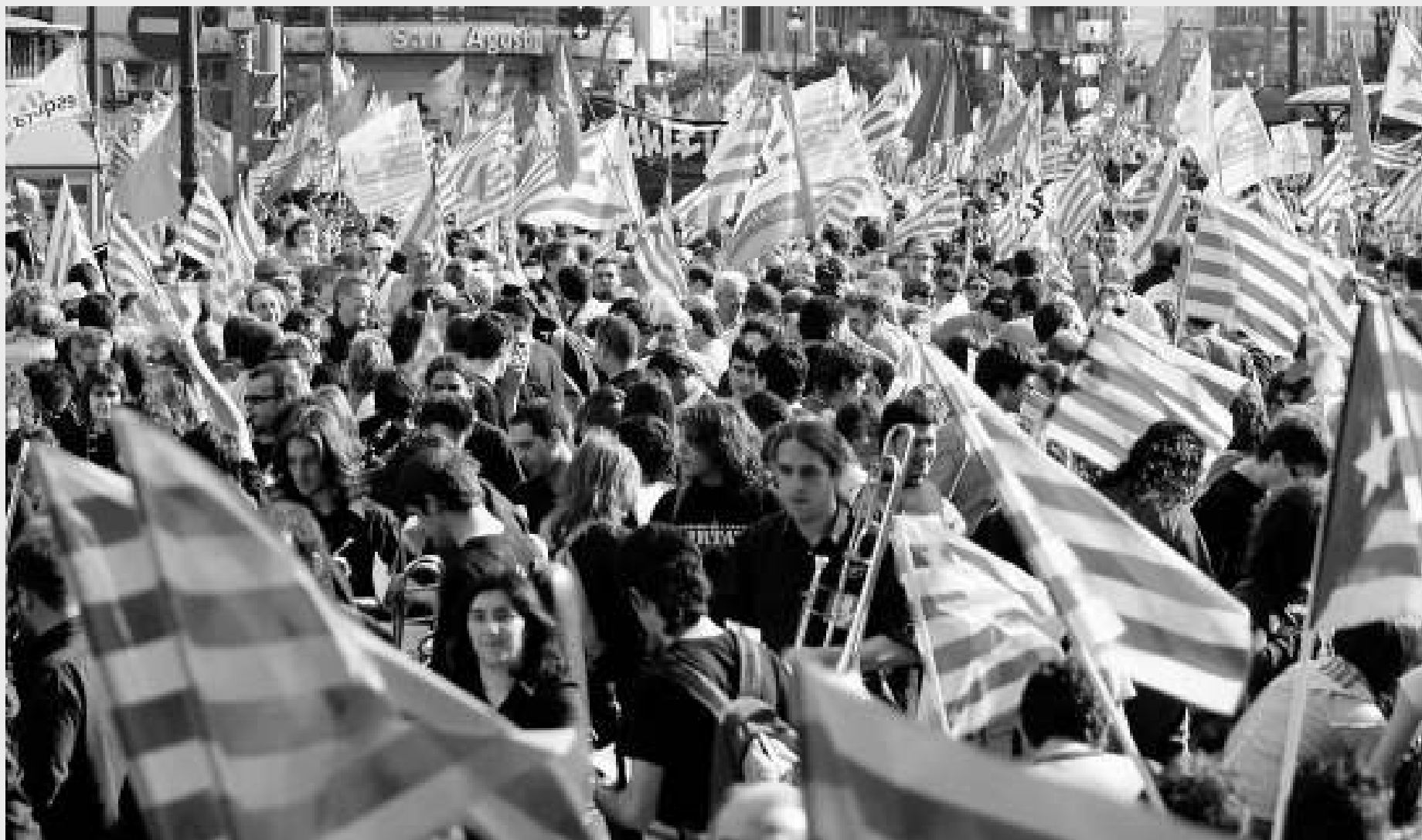
Imatge de la manifestació de l'any passat per commemorar la derrota d'Almansa, als carrers de València.