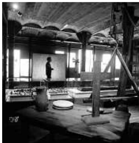
Exposició del Museu d'Història.

● La crisi econòmica i la conflictivitat social, i el clima d'intolerància religiosa que va néixer de la Reforma i la Contrareforma, van propiciar la cacera de bruixes a Europa. A Catalunya, la persecució es va produir entre els anys 1616 i 1622, fins que la majoria de bisbes catalans es van manifestar a favor d'aturar aquesta repressió. L'any 1622, la Reial Audiència va decidir revocar totes les causes pendents, i els processos van passar a la seva jurisdicció, abans que totes les encausades fossin alliberades. Tot això és el que s'explica en l'exposició Per