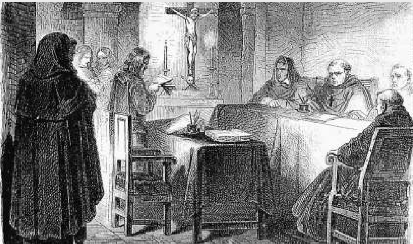
Un tribunal de la Inquisició en la vista d'una causa. Els conversos judaïtzants també van ser examinats de prop pel Sant Ofici.

Ferran II i Isabel van signar el decret d'expulsió dels jueus el 31 de març del 1492, tot i que no