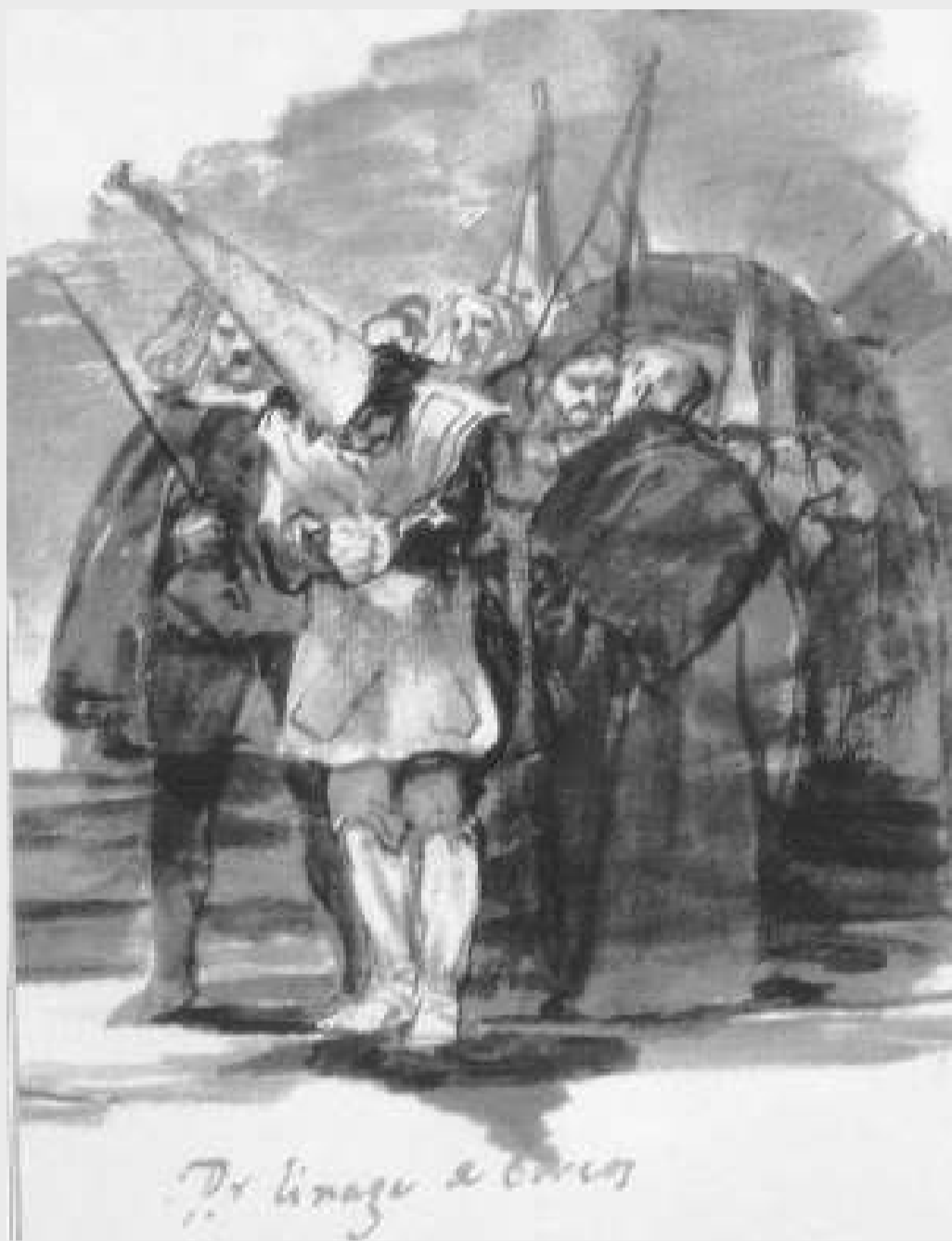
Goya va pintar diverses escenes de la Inquisició, com aquesta, titulada Por linaje de hebreos .

La celebració de la festa del sàbat (dissabte sant) va ser una