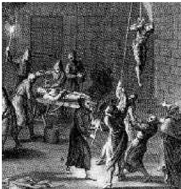
Gravat que mostra com es torturava als detinguts.

El manual d'Eimeric, que va servir de referència als inquisidors posteriors, deia que no es podia turmentar dones embarassades, i que als vells i