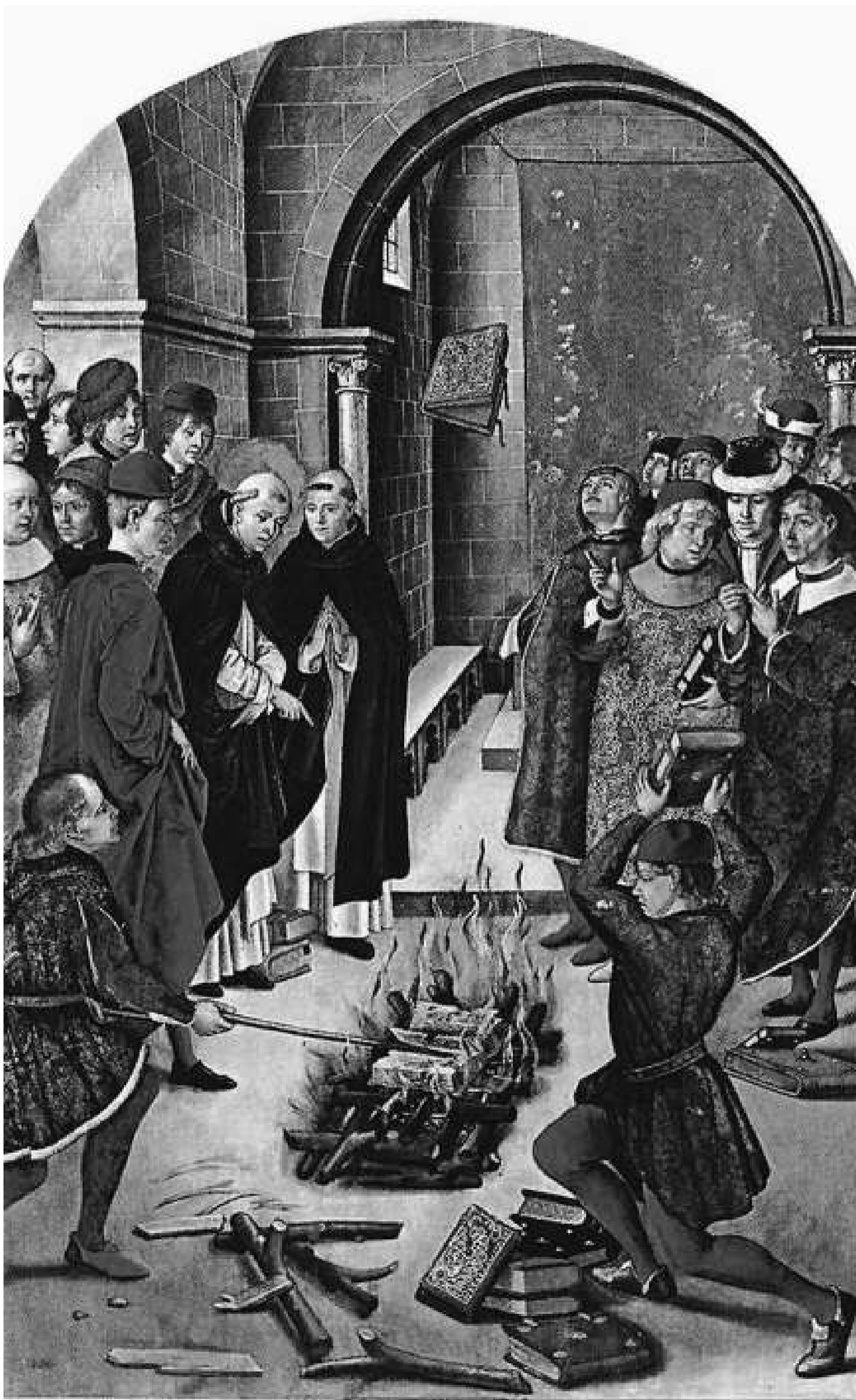
Les escenes de la crema de llibres, com la d'aquesta pintura antiga, van ser una de les imatges que més van il·lustrar la Inquisició.

doncs, no veien cap necessitat de tenir un altre tribunal imposat des de fora, però després de diversos estira-i-arroses entre el Consell de Cent i el rei, al final van haver de sucumbir a aquesta voluntat centralitzadora imposada per damunt de les institucions forals. El 5 de juliol del 1487 van entrar a Barcelona dos inquisidors espanyols: Alfonso de Espina i Sancho Marín, nomenats pel primer inquisidor general, Tomás de Torquemada. Espina i Marín van ser l'objectiu al qual es van dirigir les primeres queixes dels consellers de Barcelona, ja que actuaven «contra leys, practiques, costums e libertats de la dita ciutat».