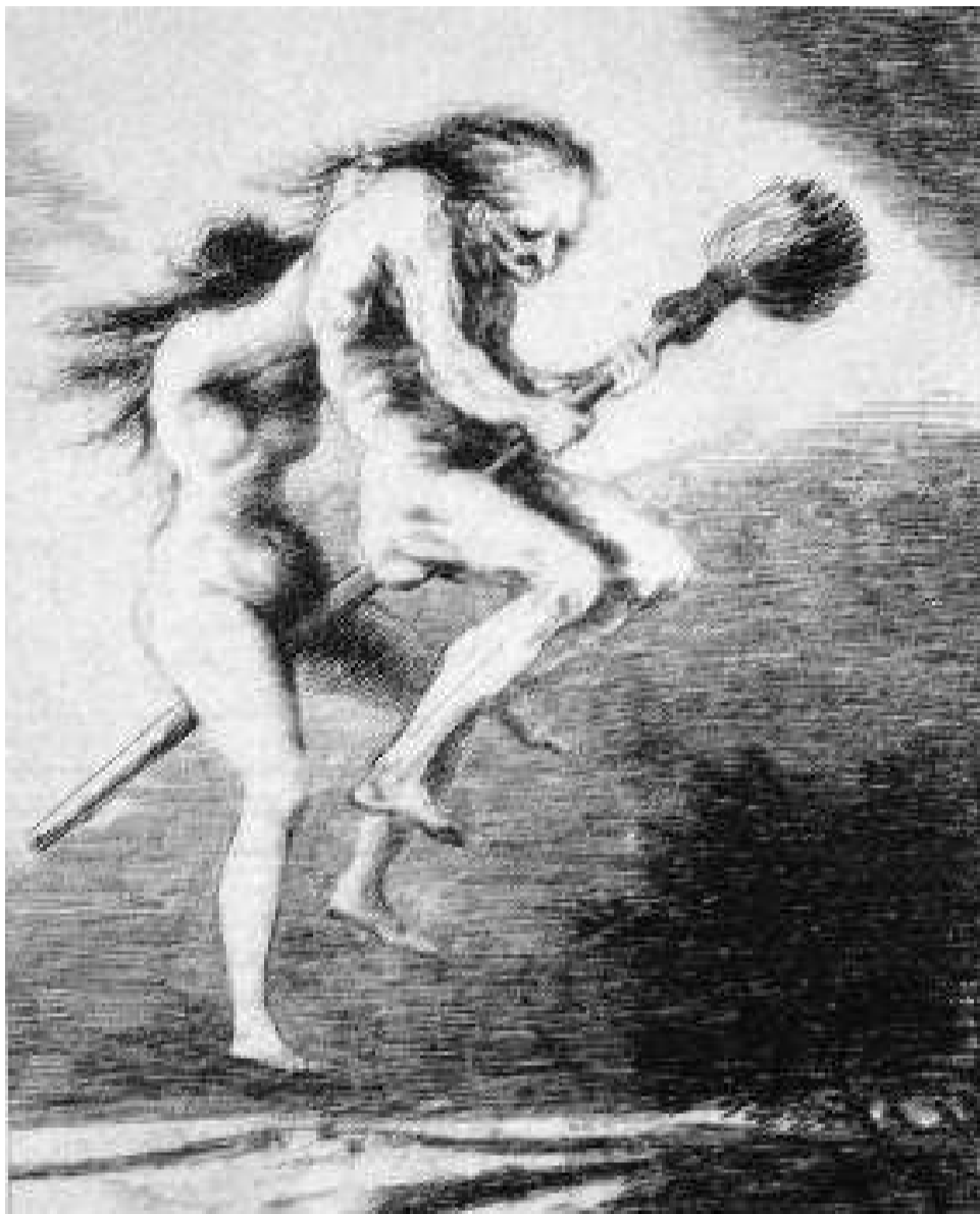
Linda maestra, obra de Francisco de Goya representant la bruixeria.