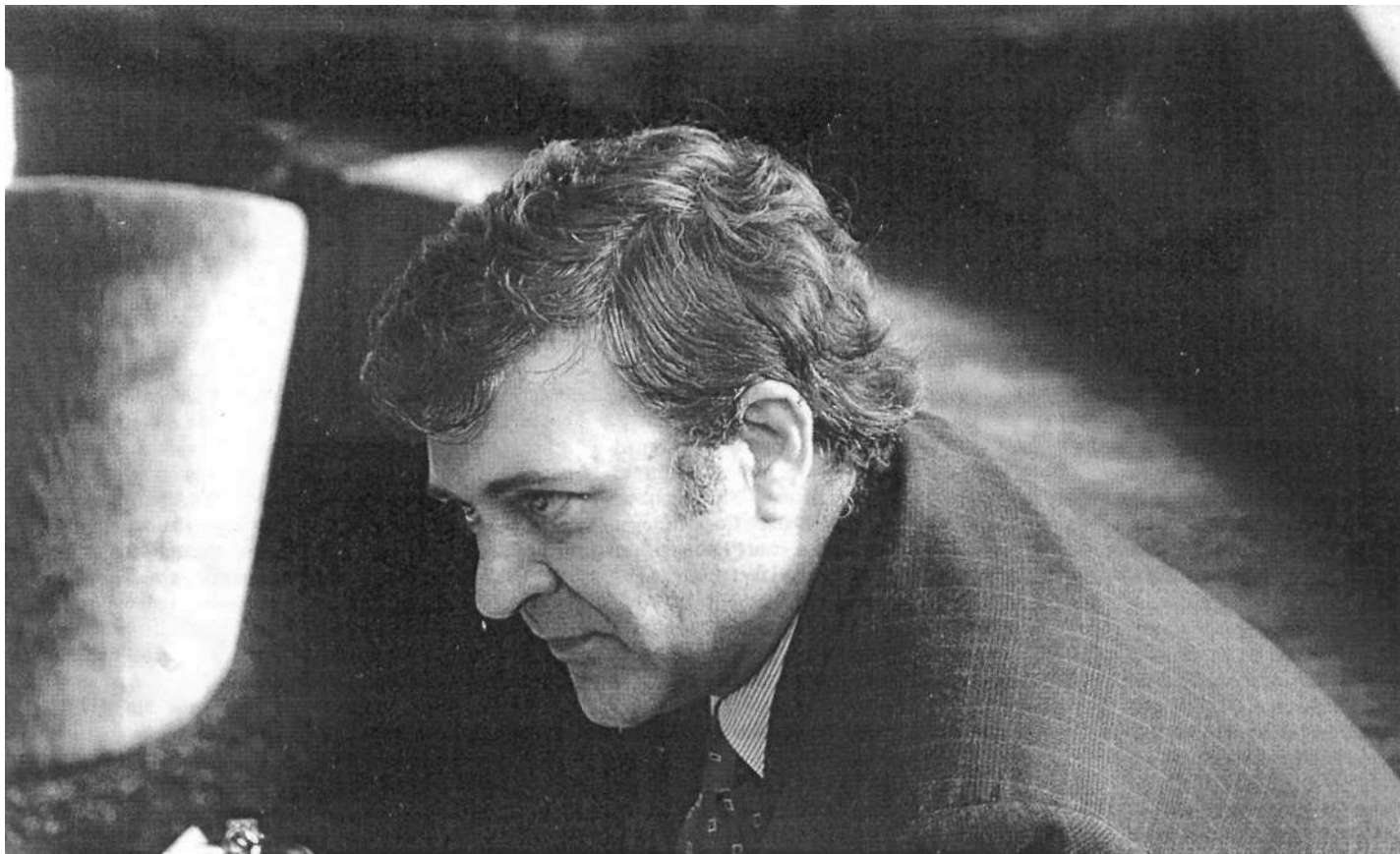
Alfons López Tena escriu que la supervivència nacional de Catalunya ha estat una anomalia, un miracle, però indica també que els miracles no duren indefinidament.