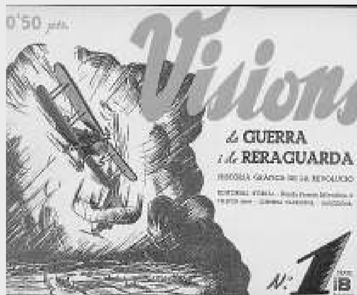
Les publicacions il·lustrades, amb dissenys d'avantguarda.