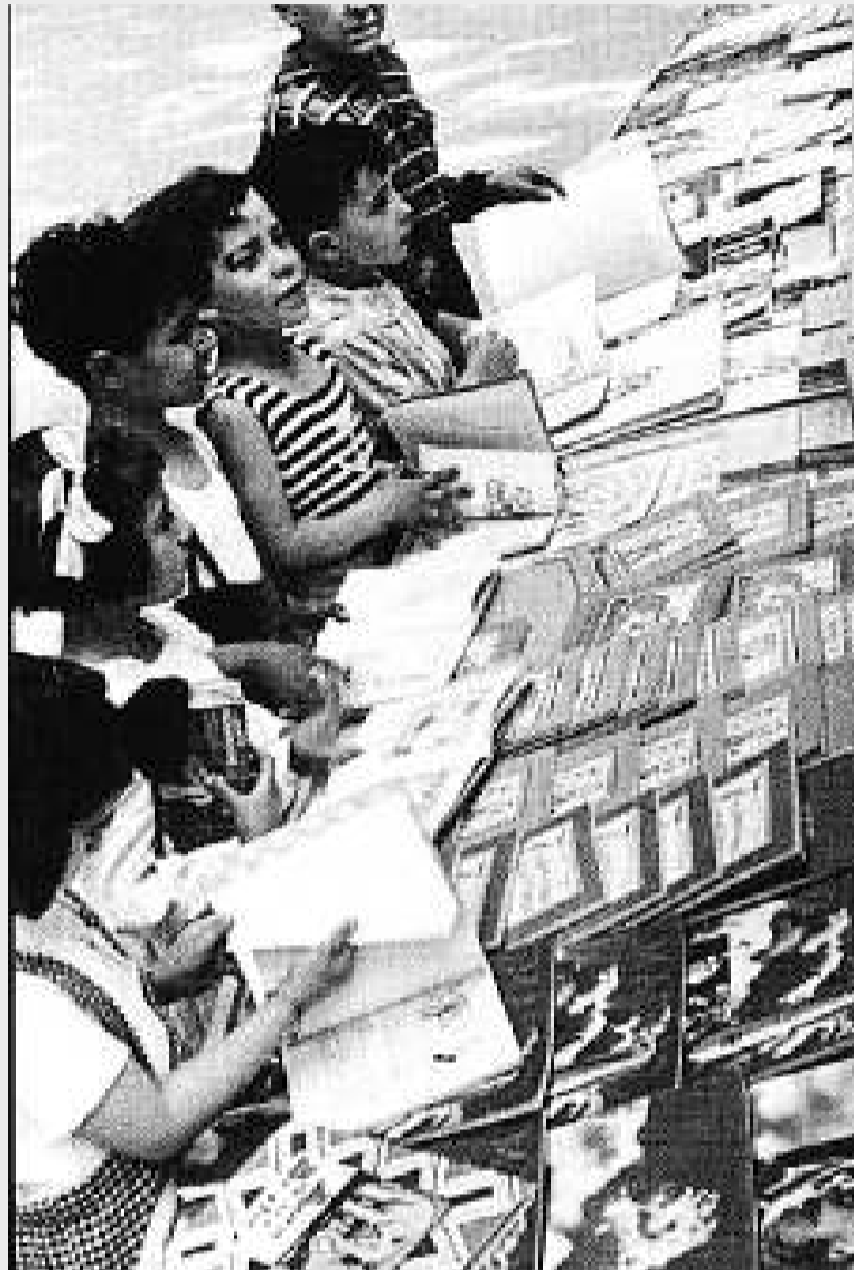
La literatura infantil transmetia valors republicans i de catalanitat.

van distribuir per tota la xarxa de biblioteques populars de la Generalitat, és «una prova palpable més –comenta Foguet– de les preocupacions de les autoritats republicanes per mantenir en ac-