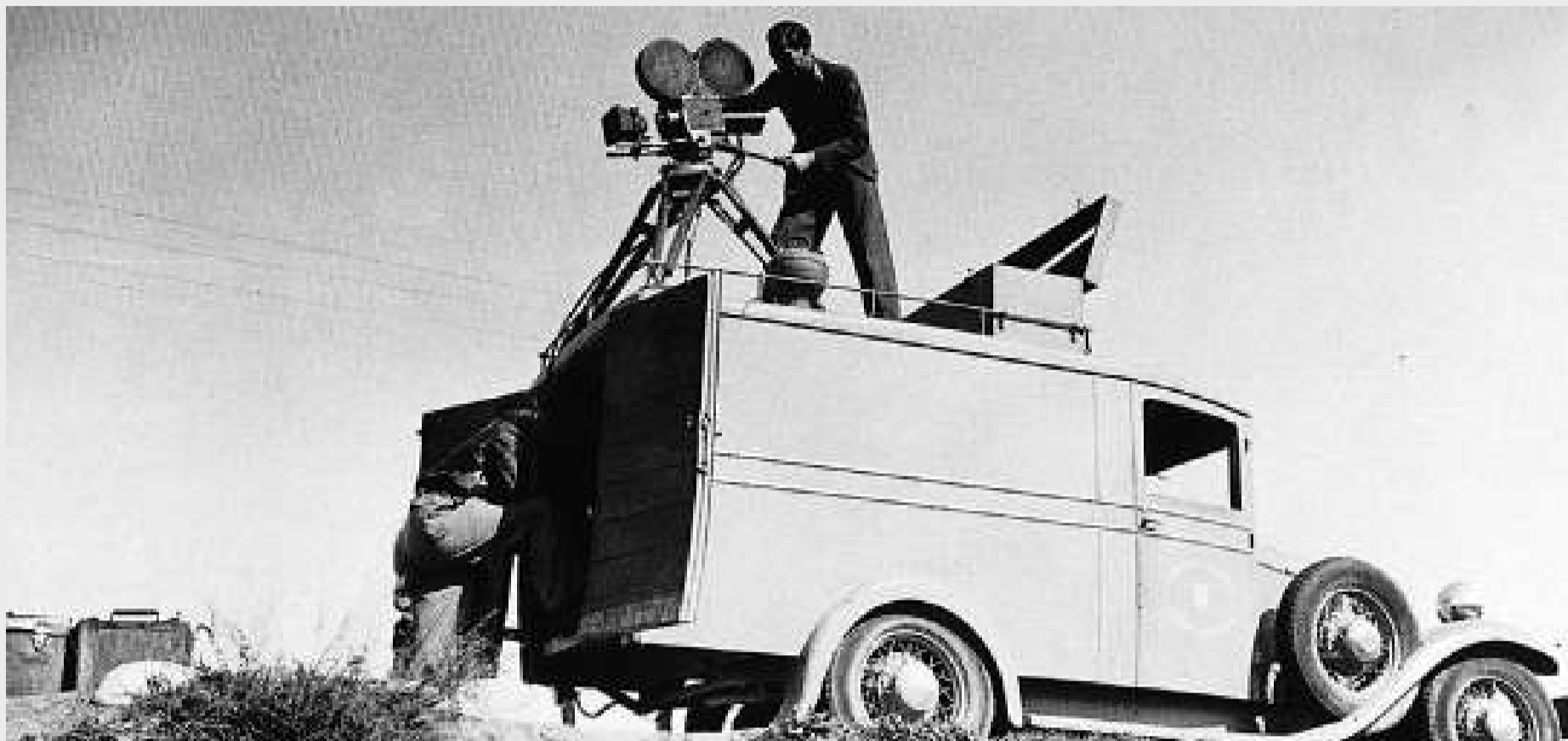
Laya Films disposava d'un camió per fer projeccions al front –en aquesta imatge, al front d'Aragó–, i d'un camió impremta i de cinema per fer edicions i projeccions ràpides.