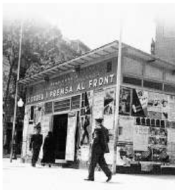
Cartells a París de la mostra sobre l'art medieval català. A la dreta, una oficina de correu i premsa al front.

els facciosos espanyols utilitzaven armament italià o alemany. A París, l'exposició sobre l'art medieval català, acompanyada de l'edició de diversos catàlegs i llibres, passava del Jeu de Paume al Château de Maisons-Laffitte i aconseguia en total més de 300.000 visitants. Aquell mateix estiu, al famós Pavelló de la República de l'Exposició Internacional, la Generalitat va presentar una exposició sobre la premsa catalana, documentada des del 1641, que va merèixer una medalla al mèrit.