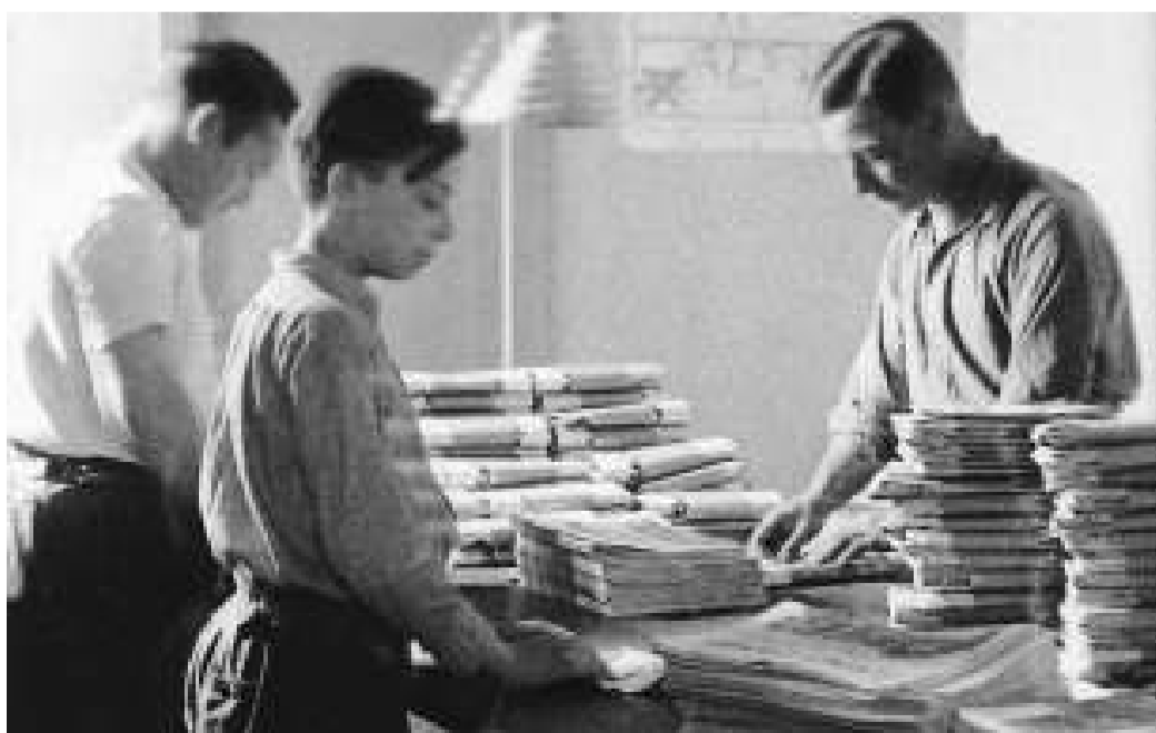
El Comissariat enviava llibres lil-liputencs, premsa i fulls volants al front.